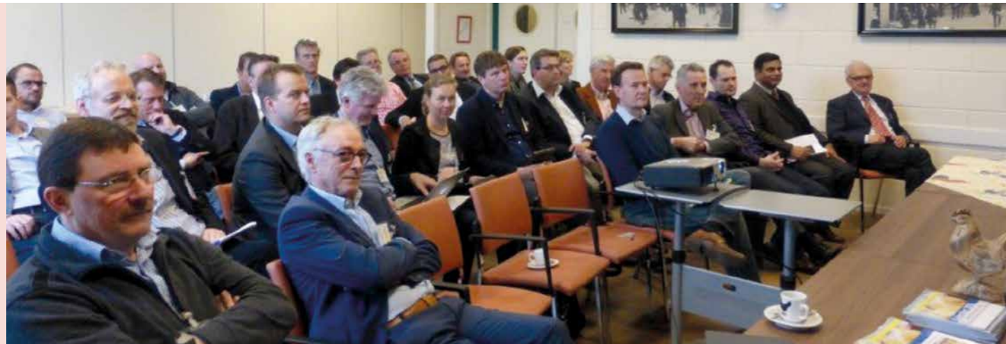
Poultry India Business Event